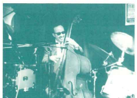
▲演奏中の衰輪さん。大人の魅力がいっぱい!